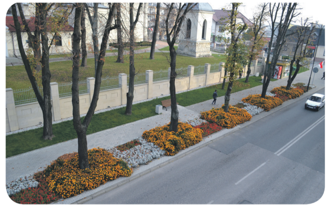
Zagospodarowanie terenów przy ulicy Boh. Warszawy