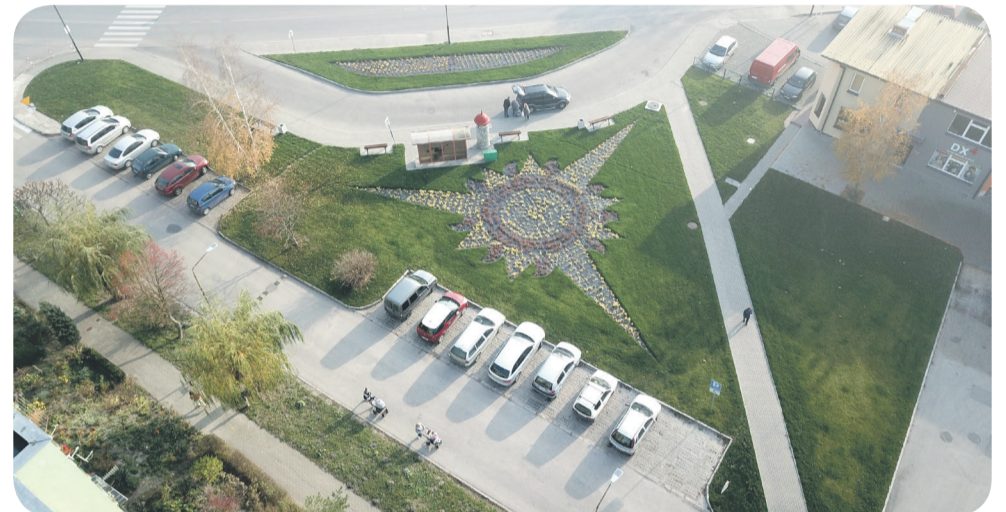
Skwer zieleni na osiedlu Piłsudskiego

W wyniku przeprowadzonych prac w mieście powstało kilkanaście nowych skwerów, które zdecydowanie poprawiły estetykę ulic. Nowe trawniki, barwne ukwiecenia, schludnie przycięte krzewy i drzewa liczne ławeczki parkowe i kosze na śmieci – to wszystko sprawia, że zarówno kuracjusze i turyści, jak też