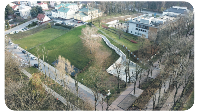
Zagospodarowanie terenów zielonych przy ul. Spacerowej (rejon Byczej Góry)

dował ciagi pieszo – jezdne, zamontował ławki parkowe, kosze na śmieci. Nawieziono nowej ziemi, w której nasadzono nową, ozdobną roślinność, przyjazną dla ludzi, zwierząt, ptactwa i owadów. Być może zainteresuje naszych Czytelników to, czym już wkrótce będziemy mogli cieszyć oczy odpoczywając w zdrojowych parkach. Kostrzewa walezyjska, trzmielina, róża okrywowa, ostnica włosowata, brzoza brodawkowa, miskant