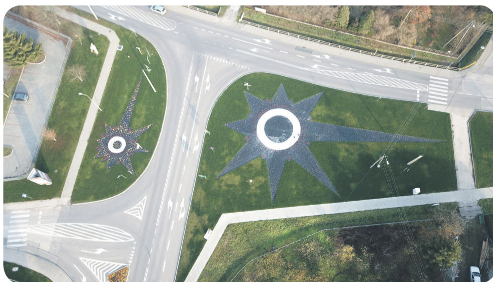
Skwer zieleni przy ulicy Grotta

tem prowadzone były: na ul. Bohaterów Warszawy (w okolicach kościoła NP-NMP), na skrzyżowaniu ul. Partyzantów i ul. Łagiewnickiej, na terenie parkingu przy ul. Partyzantów, na ul. Kilińskiego, na ul. Kościuszki (os. Andersa), na os. Andersa (rejon kościoła św. Leonarda i dojścia do ul. Młyńskiej, na ul. Bohaterów Warszawy (os