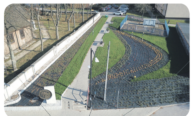
Skwer zieleni na osiedlu Andersa