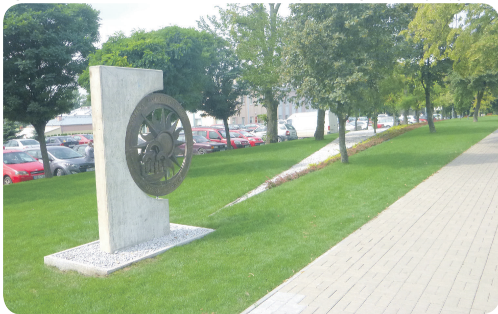
Skwer Godzwna przy alei Mickiewicza

Całość prac kosztowała 5 milionów 635 tysięcy 226 złotych, dofinansowanie zaś wyniosło 4 miliony 494 tysiące 18 złotych i stanowi 85% kosztów kwalifikowanych.