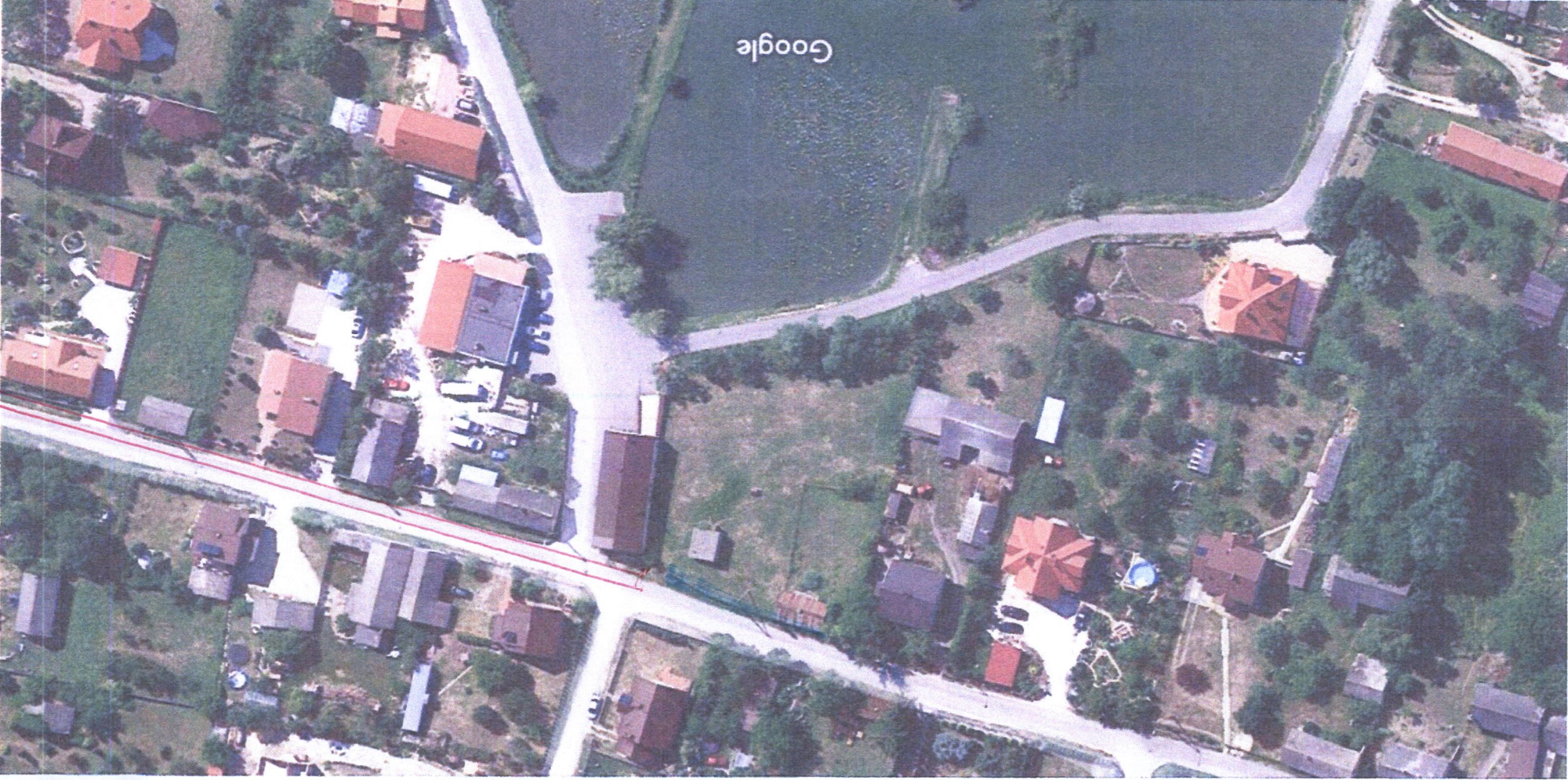
20 m